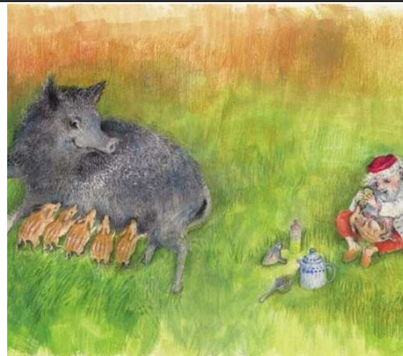
Für den Raben Huckebein, für das wilde Wurzelschwein

Seniorentextil.de – ein Webshop der MODA Textilagentur Weiss GmbH • Mollstraße 12 • D - 59348 Lüdinghausen Telefon: +49. 2591. 893994 • Telefax: +49. 2591. 893995 • Mobil: + 49. 178. 2545 596 E - Mail: welcome@modatextil.de Volksbank Seppenrade • Konto 13 505 201 • BLZ 400 696 22 USt. - ID Nr.: DE 811977488 • AG Coesfeld HRB 7614 Geschäftsführer: Hans Günter Weiß www.modatextil.de • www.seniorentextil.de • www.allergikerwaesche.de