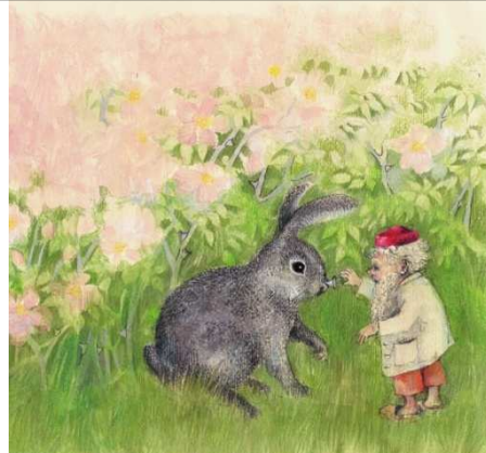
Für Kaninchen Nüppelnas, für den kranken Humpelhas