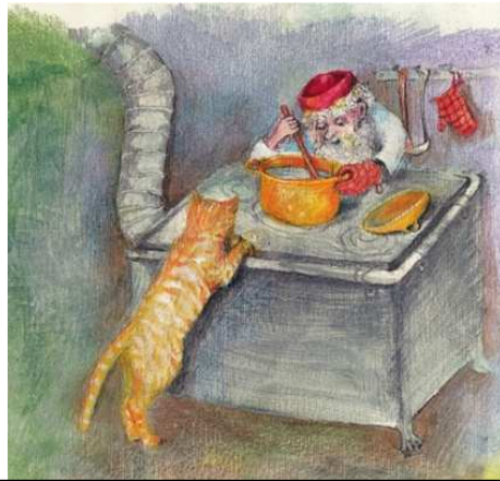
Was da weh und was da wund, macht der Haulemann gesund, kocht ein Süppchen auf dem Herd